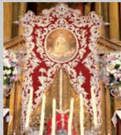
La Primera y Más Antigua Hermandad de Nuestra Señora del Rocío de Villamanrique de la Condesa

Por este extraordinario motivo, la Primera y Más Antigua Hermandad de Nuestra Señora del Rocío de Villamanrique de la Condesa está realizando actos conmemorativos durante todo el año, en el que esperamos que todos sus hermanos y el pueblo entero de Villamanrique se vuelquen para el disfrute de esta gran celebración.